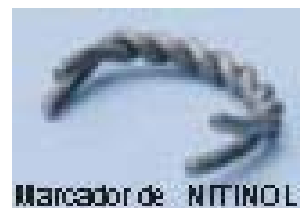
Marcador de NITINOL