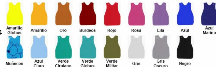
AN40 - S