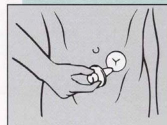
Modalidad de Uso del Dilatador DILASTOM